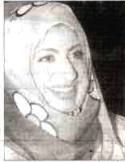
● باسمه الذهب

وغير بالذکر ان معرض العطور قد اجتذبت لزيارته كل من حديشي وشلوب والشركة العربية الدولية للعود والسرني للعطور واطياب المرشود وسيد جنيد عالم وشارمل للتجميل وعطورات